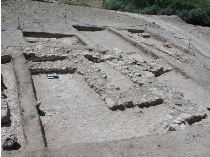
Resim. 2: Dış Kentten Görünüm