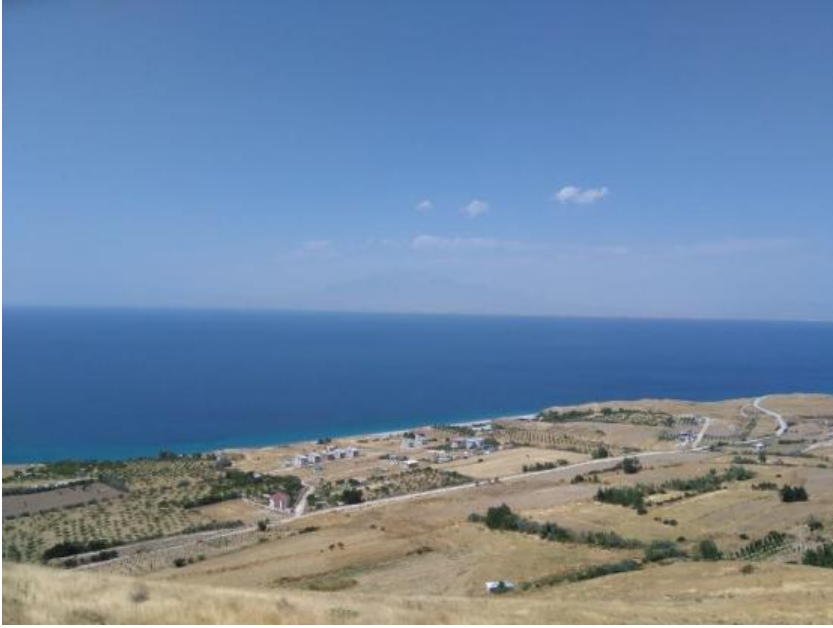
Resim. 4: Ayanis Kalesi'nden yanındaki sahilin görünümü