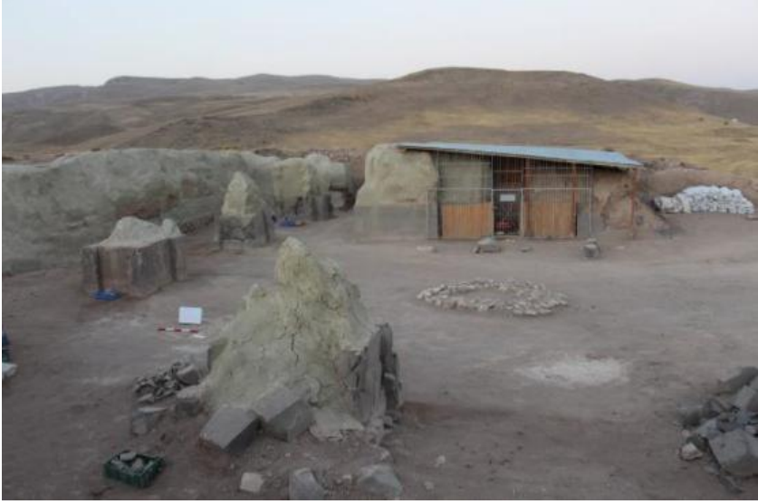
Resim.1: Kaleden (Tapınak Alanı) Görünüm