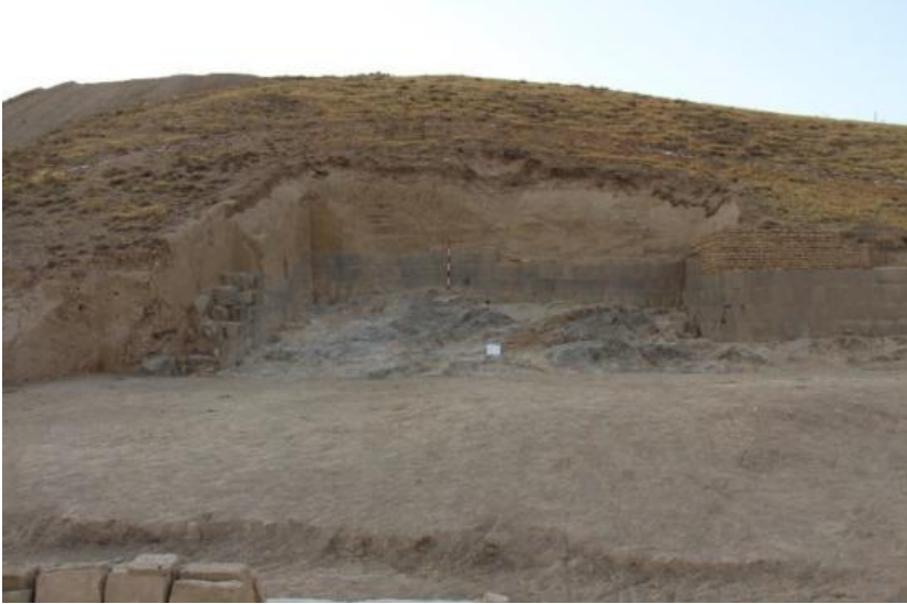
Resim. 3: Kale'nin temelini oluşturan kaya birikimi (Güney Surdan)

jeomorfolojik) sahip olduğundan eko turizm açısından büyük potansiyele sahiptir (Alaeddinoğlu ve diğ., 2014, 245-246) 5 . Bu zengin havza jeomorfolojik bakımdan mezozoik-tersiyer araziler, volkanik koniler ve lav sahalarıyla çevrilidir (Alaeddinoğlu, 2014, 264). Jeolojik özellikleriyle bir yelpazeyi andıran bu coğrafyada Ayanis/Ağartı Köyü aktif bir heyelan kütlelerinin üzerinde bulunmaktadır (Öner, 2002, 52). Ayanis Kalesi jura yaşlı, sparit damarlı mikritik kireçtaşı birimler üzerine konumlandırılmıştır. Kalenin temelini oluşturan bu kayalığın yükseltisinin oldukça sert, dayanımlı, az-orta derece ayrılmış bir özellik sunduğu belirtilmektedir (Resim: 3), (Şengül ve diğ., 2016, 161-164).