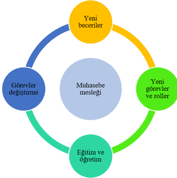
Şekil 1. Yapay Zekânın Muhasebe Mesleği Üzerindeki Etki Alanları Kaynak: Stancheva-Todorova, 2018: 135.

Muhasebe alanındaki yapay zekâ uygulamalarının geçmişi 1980'lere kadar uzanmaktadır. Bu kapsamda denetim, vergilendirme, finansal muhasebe, yönetim muhasebesi ve kişisel finansal planlama konularında araştırmalar yapılmıştır (Baldwin vd. 2007: 77). Muhasebe mesleğine yapay zekânın girmesiyle beraber iş ortamında ve yönetimdeki olası değişikliklere uyum sağlanmaya çalışılmalıdır (Şekil 1). Muhasebecilerin yeteneklerinin yapay zekâ ile birleştirmesiyle; daha iyi ve ucuza mal olan veriler sağlanarak işletmede karar verme aşaması desteklenmektedir. Bu bağlamda muhasebe meslek mensupları; verilerin derinlemesine analizini yapma, mesleki yeni bilgiler elde etme ve yapay zekânın uygulanması ile çalışma sürelerinde meydana gelen azalmadan dolayı başka görevlere odaklanma gibi fırsatlar elde edebilecektir (ICAEW, 2018).