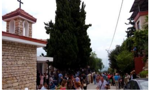
Foto 1: Vakıflı köyünde yer alan Surp Asdvadzadzin Ermeni Kilisesi, Samandağ ilçesine 4 km uzaklıkta ve halen Türkiye'nin tek Ermeni köyü olarak bilinir. Her yıl ağustos ayında Meryem Ana Yortusunu kutlamamak için büyük ziyaretçi akınına uğramaktadır.

Samandağ yöresindeki inançsal, kültürel ve doğal turizm potansiyelleri lokal olmakla birlikte, önemli turizm destinasyonlarına sahip çeşitli zenginlik ve turistlerin tercihleri dikkat çekici niteliktedir. Samandağ ilçesinin Deniz, Çevlik, Meydan mahalleleri gibi yerleşim birimleri (daha önce, köy statüsünde olan bu yerleşim birimleri, Aralık 2012 tarihinde ve 6360 sayılı "Büyükşehir Belediye Yasası" ile mahalle statüsü kazandılar), aynı zamanda önemli birer kıyı/sahil turizm alanlarıdır. Deniz Mahallesi'ndeki Hızır Türbesi, Vakıflı Köyü'ndeki Surp Asdvadzadzin Ermeni Kilisesi (Foto 1) ve Zeytuni Mahallesi'ndeki Ortodoks Kilisesi ise, önemli inanç destinasyonlarıdır. Çevlik civarında Roma Dönemi'nden kalma Titus Tüneli (Foto 2) ve Beşikli Mağaraları ile Hıdırbey Köyü'nde bulunan Musa Ağacı (Foto 3) ve yöreye özgü ürünler (Foto 4), turizmin önemli çekicilikleri arasında yer almaktadırlar. Ayrıca Batıyaz Köyü de doğal güzellikleriyle dikkat çeken önemli alanlardandır. Doğal zenginlikler, tarihi, kültürel ve toplumsal dokunun çokkültürlü olması, Samandağ yöresine olan ziyaret talebini ve ilgiliyi artırmaktadır. Bölgesel çatışma ve kaosların dindiği, toplumsal barış ve huzurun egemen olduğu dönemlerde, turistlerin yöreye olan yoğun ziyaretleri de bu durumu destekler niteliktedir.