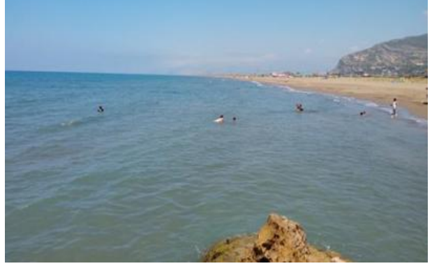
Foto 5: Meydan Köyü, Samandağ ilçe merkezine 9 km uzaklıkta ve hem plaj- tatil köyü hem de doğal manzarası bakımından, turistlerin yoğun ilgi gösterdiği ve ziyaret ettiği turistik alanlardandır.

Çalışmanın örneklem grubu; farklı yaş, cinsiyet, eğitim düzeyi ve mesleğe sahip 25 katılımcıdan oluşmaktadır. Katılımcılarla gerçekleştirilen ve kayıt altına alınan görüşmeler, daha sonra yazıya dökülmüş ve ilgili temalara göre tasnif edilerek, değerlendirilmiştir. Görüşmelerden temin edilen veriler, Kültür ve Turizm Bakanlığı'nın resmi verileriyle karşılaştırılarak, konuya ilişkin değerlendirmeler yapılmıştır. Görüşmeler, yöredeki turizm faaliyetleriyle doğrudan ve dolaylı şekilde bağıntılı olan çeşitli işletmeciler ve işletme çalışanlarıyla gerçekleştirilmiştir. Bu bağlamda, Suriye iç savaşının Samandağ ilçesindeki turizm faaliyetlerini nasıl etkilediği ve ne tür gelişmelere neden olduğu sorularına cevaplar arandı. Ayrıca, savaş ortamındaki olumsuzlukların Samandağ yöresine taşınması ve mevcut olumsuzlukların giderilmesi için de çeşitli öneriler geliştirilmiştir. Bu bağlamda, Kültür ve Turizm Bakanlığı'ndan alınan veriler tablolara dönüştürülmüş, yıllar içinde Hatay iline ve Samandağ ilçesine gelen ziyaretçi sayısındaki/ turist akışındaki değişimler analiz edilmiştir.