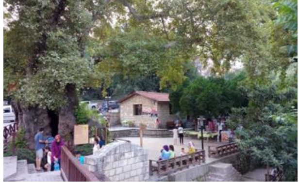
Foto 3: Hıdırbey köyünde bulunan devasa çınar ağacı, Musa ağacı olarak bilinir. Kültür Varlıkları Koruma Kurulu tarafından anıt ağaç olarak ilan edilmiş ve koruma altına alınmıştır. 800-1000 yaşlarında olduğu tahmin edilen ağacın, gövde çapı 7,5m. çevresi 20 m. ve yüksekliği ise, 17m'dir. Ağacın, Hz Musa'nın yörede geçerken, asasını unuttuğu ve asasının filizlenerek ağaç olduğuna inanılmakta ve binlerce turist tarafından ziyaret etmektedir.

Klimatik özelliklerin elverişliliği, Akdeniz bölgesinin genelinde olduğu gibi, Samandağ ve yakın çevresinde de zengin kültürel formların gelişmesine olanak sağlamıştır. Özellikle tarımsal ürünler (başta zeytin, zahter ve turuncgiller olmak üzere mısır, biber vb.) yöre için önemli geçim kaynaklarıdır. Ayrıca, Hatay yöresini Ortadoğu ülkelerine bağlayan Belen Geçidi de, uluslararası ulaşım aksı olarak, hem Samandağ yöresinin hem de Doğu Akdeniz ve dolayısıyla Türkiye için önemli bir ticaret aygıtıdır. Beşeri kültürel kimlikler açısından da zengin olan Samandağ ilçesi, dinsel ve mezhepsel olarak çeşitlilik göstermektedir. Özellikle doğu ve batı için önemli bir kesişim ve kültürel etkileşim alanı (Özgen, 2011) olarak Samandağ/ Hatay yöresinde birbiriyle ilintili olarak doğal ve kültürel turizm arz potansiyelleri mevcuttur. Yörede, Arap Alevileri, Sünniler, Hıristiyan Ortodoks ve Katolik vatandaşlar yaşamaktadır. Etnik olarak da daha çok Arap, Ermeni ve Türkmen vatandaşlar yer almaktadır. Ayrıca, yörenin önemli turizm destinasyonları Titus Tüneli, Musa Ağacı, Beşikli Mağara, Çevlik Plajı (Foto 5), Ermeni Katolik Kilisesi (Surp Asdvadzadzin Ermeni Kilisesi) ve yakın çevredeki Seleucia Pieria ve St. Simon Manastırı'dır (Şekil 1). Kültür ve Turizm Bakanlığı verilerine (2006) göre, Samandağ ilçesinde, 125 oda ve 312 yataklı 9 otel bulunmaktadır.