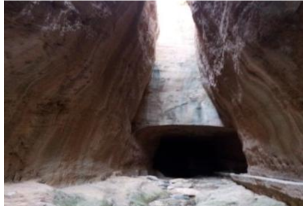
Foto 2: Samandağ ilçe merkezine 5 km mesafede, Çevlik mahallesinde yer alan Titus Tüneli, sel sularının, yüksek dağlık alanlardan taşıdığı malzemelerin limana akmasını önlemek ve liman dışına akaçlamak için M.Ö. 300 yılında yapılmıştır. Yüksekliği 7m, genişliği, 6m uzunluğu ise, 1380 m'dir

Samandağ, Türkiye- Suriye sınırında yer alan ve idari ünite olarak, Hatay iline bağlı bir ilçedir. Samandağ ilçesi, Hatay il merkezine (Antakya) yaklaşık 25 km mesafededir. 2016 yılı itibarıyla nüfusu 120.000 kişi olan ilçenin toplam yüzölçümü 446 km 2 'dir. İlçenin kuzeybatısında Amanos-Musa dağı, doğusunda Saman dağı, güneydoğusunda Keldağ- Ziyaret dağı yer almaktadır. İlçenin batısında ise, Akdeniz ile sınırlıdır. Akdeniz kıyısında yer alan Samandağ ilçesinin denizden yüksekliği takriben 15 m'dir. Tipik Akdeniz iklim koşullarının etkili olduğu yörede, yağışlar kış döneminde yoğunlaşırken, yaz mevsiminde ise bunaltıcı sıcaklıklar hâkimdir. İlçenin yıllık ortalama sıcaklığı 18.8 °C'dir. Yıllık ortalama yağış miktarı 949 mm'dir.