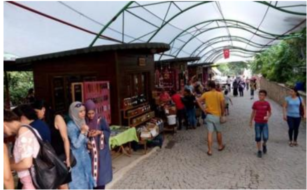
Foto 4: Hıdırbey köyünde, yöre halkının ürettiği çeşitli tarımsal ve tasarımsal ürünler pazarlanmaktadır. Nar ekşisi, zeytinyağı, defne sabunu, çeşitli baharatlar, likörler, reçeller, katı ve biberli ekmeğin yanı sıra, birçok süs ve hediyelik eşya, yöre için önemli bir ekonomik getiri kaynağıdır.

Alan araştırmasında, görüşlerine başvurulmuş katılımcılar sırasıyla kısaltılarak kodlanmış (K1, K2, K3...) ve metin içinde ilgili alana görüşleri refere edilmiştir. Örneklem grubunu oluşturan 25 katılımcının 12’si (% 48) kadın, 13’ü (% 52) ise erkek katılımcılardan oluşmaktadır. Ayrıca, metin içinde görüşlerine başvurulmuş her katılımcının cinsiyet, yaş, eğitim durumu ve mesleği de belirtilmiştir. Konuyla ilgili olarak, katılımcıların görüşlerine başvurulmuş ve bu bağlamda elde edilen görüşler özenle değerlendirilmiştir.