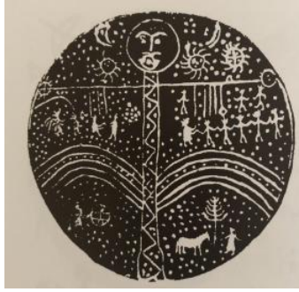
Resim1: Altay Davulu

Ritüel gerçekleştirecek olan şamanın yurtunun içinde ve önünde bu ağacın benzerleri ya da temsilcileri bulunmaktadır. Ritüel sırasında kayın ağacına tırmanan şaman, aslında Kozmik Ağaca tırmanarak, yeryüzüne seyahat etmektedir. kozmik ağaç, yeryüzünün tam ortasında yerden yükselmekte ve dalları göğün en üst katmanında oturan Bay Ülgen'in sarayına kadar ulaşmaktadır.