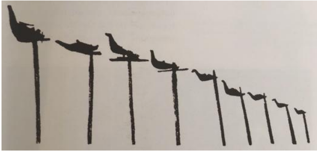
Resim 2: Dokuz kat göğü sembolize eden ağaçlar

Dünyanın ekseninde yer alan ağaca tırmanarak göğe çıkma, fikri evrensel ve arkaik bir fikir olup, kozmolojik inanıştaki 7 ya da 9 katlı göğün aşılması anlamına gelmektedir. Şaman gökyüzüne yapacağı yolculuk için başladığı töreninde, üzerine göğün 7 ya da 9 katını temsil eden 7 veya 9 taptı (çentik) atılmış bir ağaca tırmanmaktadır. Göğün katları benzer inanışlarda farklı sayılarla karşımıza çıkmaktadır; Altaylılar 7,12,16, ya da 27 gökten söz ederken, Teleütler 16 kat göğün varlığına inanmakta ve şaman ağacında da bu katları temsil eden 16 çentik bulunmaktadır (Eliade, 2014: 344).