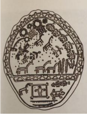
Resim 3: Güneş- Ay – Dünya ağacı

Ritüelde kullanılan davulların iç ve dış kesimlerinde gizemli resimler yer almaktadır. Bunlar süslemeler değil, anlamlı işaretlerdir ve şaman kültürünün dünya görüşünü tasvir etmektedirler. Boyanmış işaretler arasında en önemlileri güneş, ay ve dünya ağacı resimleridir. Bu ağaç dünyanın ortasını işaretlemektedir.