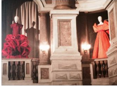
Mantua Bibiena tiyatrosu Roberto Capucci kreasyonları 2 Haziran 2012 Mantua, İtalya (URL 14).