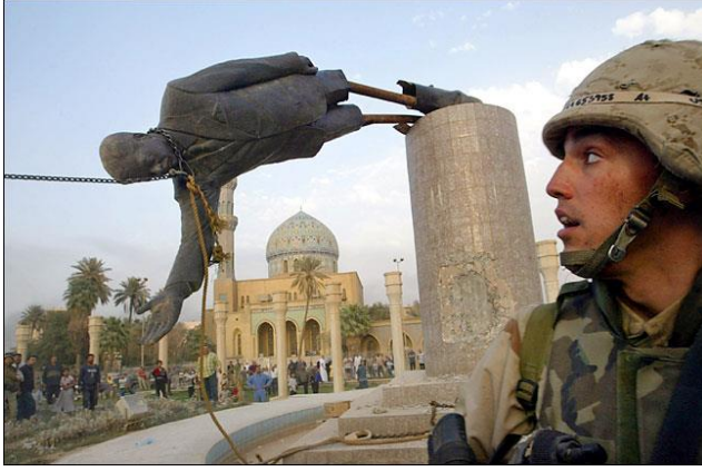
Görsel IV: Saddam Hüseyin heykelinin devrilişi, Bağdat, 2003

Antik çağlardan bu yana hükümdar imgeleri aynı zamanda gücün de simgesi halinde sunula gelmiştir. Tanrının yeryüzündeki sureti ve sıfatlarının taşıyıcısı olan hükümdar paraların üzerinde, heykellerinde ve resimlerinde güçlü ve muzafferdir. Tam da bu sebeple devrilen hükümdarın ivedilikle imajının ortadan kaldırılması gerekmektedir. Saddam Hüseyin, Che Guevara ve Muammer Kaddafi'nin yanı sıra Amerikan propaganda sisteminin hedefi olan ve yenilgiye uğrayan birçok liderin sonu aynı olmuştur. Mussolini sevgilisi ile birlikte kurşuna dizildikten sonra ayaklarından ters asılarak teşhir edilmiş, Adolf Hitler ise belki kendisi de muazzam bir propaganda sisteminin uygulayıcısı olduğu için bedenini yakarak intihar etmiştir.