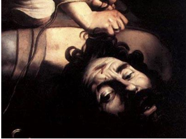
Görsel IX: Michelangelo Merisi da Caravaggio Golyat'ın kafasıyla Davut, 1600 (Ayrıntı)

Bu hikayenin sanatsal açıdan yeniden üretimlerinin en ünlüsü belki Michelangelo'nun 1504 yılında tamamladığı Davut heykelidir. Heykelde Davut'un Golyat'a saldırmadan hemen önceki hali ortaya konmuştur. Yine Michelangelo Sistin Şapeli'nde olmak üzere, Titian, Rubens, Nicolas Poussin, Claude Vignon ve Caravaggio gibi