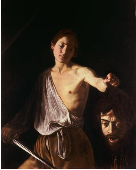
Görsel VIII: Michelangelo Merisi da Caravaggio, Golyat'ın kafasıyla Davut, 1610