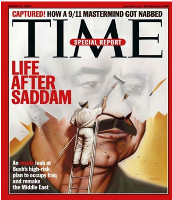
Görsel V: Time Dergisi, 10 Mart 2003

Antik çağlardan bu yana hükümdar imgeleri aynı zamanda gücün de simgesi halinde sunula gelmiştir. Tanrının yeryüzündeki sureti ve sıfatlarının taşıyıcısı olan hükümdar paraların üzerinde, heykellerinde ve resimlerinde güçlü ve muzafferdir. Tam da bu sebeple devrilen hükümdarın ivedilikle imajının ortadan kaldırılması gerekmektedir. Saddam Hüseyin, Che Guevara ve Muammer Kaddafi'nin yanı sıra Amerikan propaganda sisteminin hedefi olan ve yenilgiye uğrayan birçok liderin sonu aynı olmuştur. Mussolini sevgilisi ile birlikte kurşuna dizildikten sonra ayaklarından ters asılarak teşhir edilmiş, Adolf Hitler ise belki kendisi de muazzam bir propaganda sisteminin uygulayıcısı olduğu için bedenini yakarak intihar etmiştir.