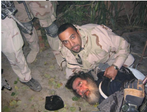
Görsel III: Saddam Hüseyin’in ele geçirilişi, 2003

Kaddafi gibi bir delikte ele geçirilen Saddam Hüseyin “ yargılanıp ” idam edilmeden önce uğradığı itibarsızlaştırma aslında ABD müdahalesinin başından bu yana Saddam imajına yapılan saldırıdan daha kuvvetli değildi.