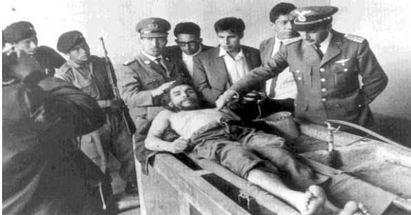
Görsel I: Che Guevara'nın otopsisi, 1967

Gözleri açık, üzeri çıplak, yakalandığına giydiği kanlı pantolonuyla teşhir edilen Che Guevara'nın ölü bedenine yapılanlar da bu mekanizmanın bir parçası ya da ölü adamdan duyulan korkudur. Che öldürüldükten sonra, önce saklanmış, sonra sergilenmiş, ardından bilinmeyen bir yerde isimsiz bir mezara gömülmüş, oradan da çıkarılıp elleri kesildikten sonra yakılmıştır (Berger, 1998:127).