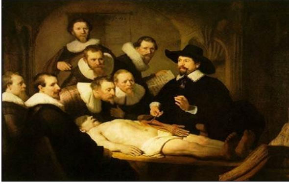
Görsel II: Rembrandt van Rijn “ Dr. Nicolaes Tulp’un Anatomi Dersi ” 1632

Che Guevara’nın öldürüldükten sonra teşhir edildiği ahırda çekilen fotoğraflarla Rembrandt’ın “ Dr. Nicolaes Tulp’un Anatomi Dersi ” adlı tablosu arasındaki benzerliğe dikkat çeken John Berger bu ikisi arasındaki temel benzerliğin amaçları olduğunu söyler. Berger’e göre tablo tıp alanında ders verirken Guevara’nın fotoğrafı siyasal bir uyarı olarak ele alınmalıdır ve verdiği ders politiktir. Bolivyalı gazeteci ve askerlerin yanı sıra bir Amerikan ajanının da başında beklediği Che’nin ölü bedeninin sergilenme amacı efsaneye son vermektir (Berger, 1998: 128).