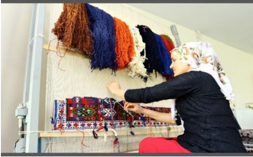
Tezgahta bir kilimin dokunuşu