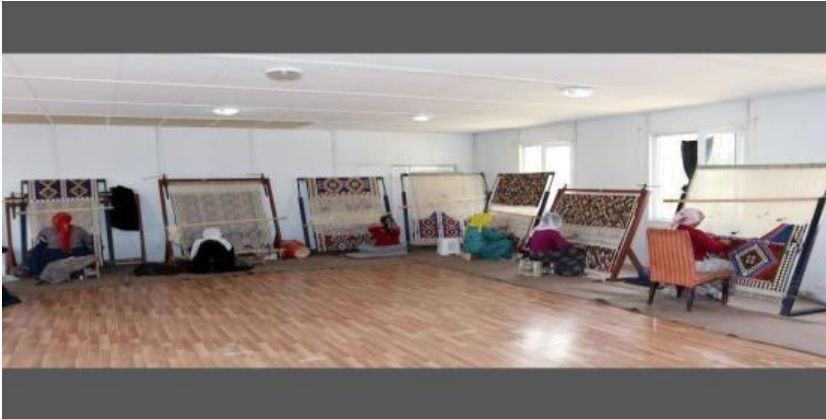
Van’da Bir Kilim Atölyesi (Van Büyük Şehir Belediyesi)

Kötü niyetli bir bakışın gözle uzaklaştırılabileceği düşüncesinden hareketle el motifinden sonra nazara karşı en fazla kullanılan motif gözdür ve bu motif Anadolu’da meydana getirilen dokumalarda karşımıza çıkmakta, göz, kemgöz, kötü göz olarak adlandırılmaktadır. İnsanları dışarıdan gelecek kötü niyetli bakışlardan korunmak amacıyla kullanılan motif, geometrik üçgen, kare, eşkenar dörtgen, haç ve yıldız şeklinde, günlük yaşamda kullanılan dokumalarda karşımıza çıkmaktadır (Ünsal, 2016: 256).