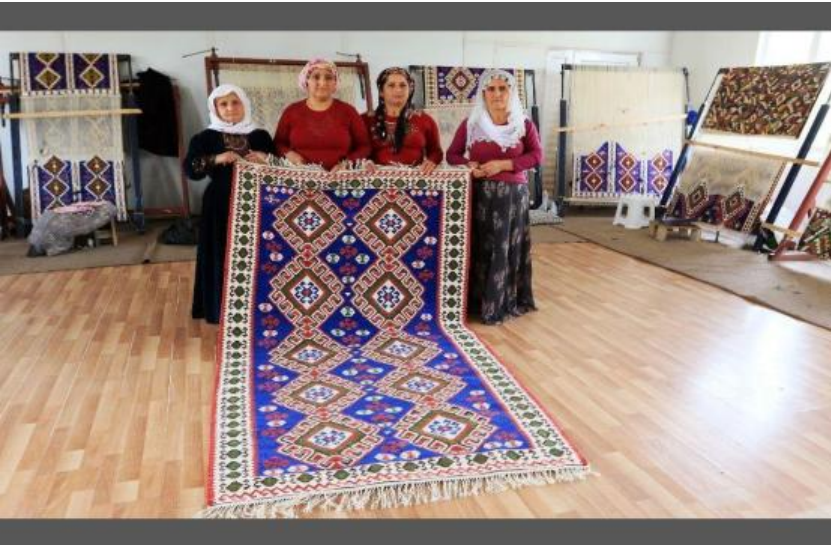
Dokudukları Van Kilimi Sergileyen dokumacılar