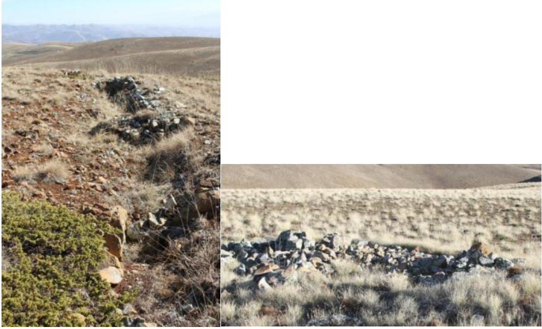
Şekil 5: Kop Dağı, mevziiler ve şehitlik

Bayburt-Kop Savunması, tarihte hakettiği değeri göremeyen pek bilinmeyen, fakat I. Dünya Savaşı'nda, doğu cephesinde Rus ordusunun durdurulmasında önemli bir yeri olan; yalnız doğu cephesinin değil, ulusun ve Anadolu topraklarının geleceğini ve tarihi seyrini değiştiren büyük bir mücadeledir. Şöyle ki: