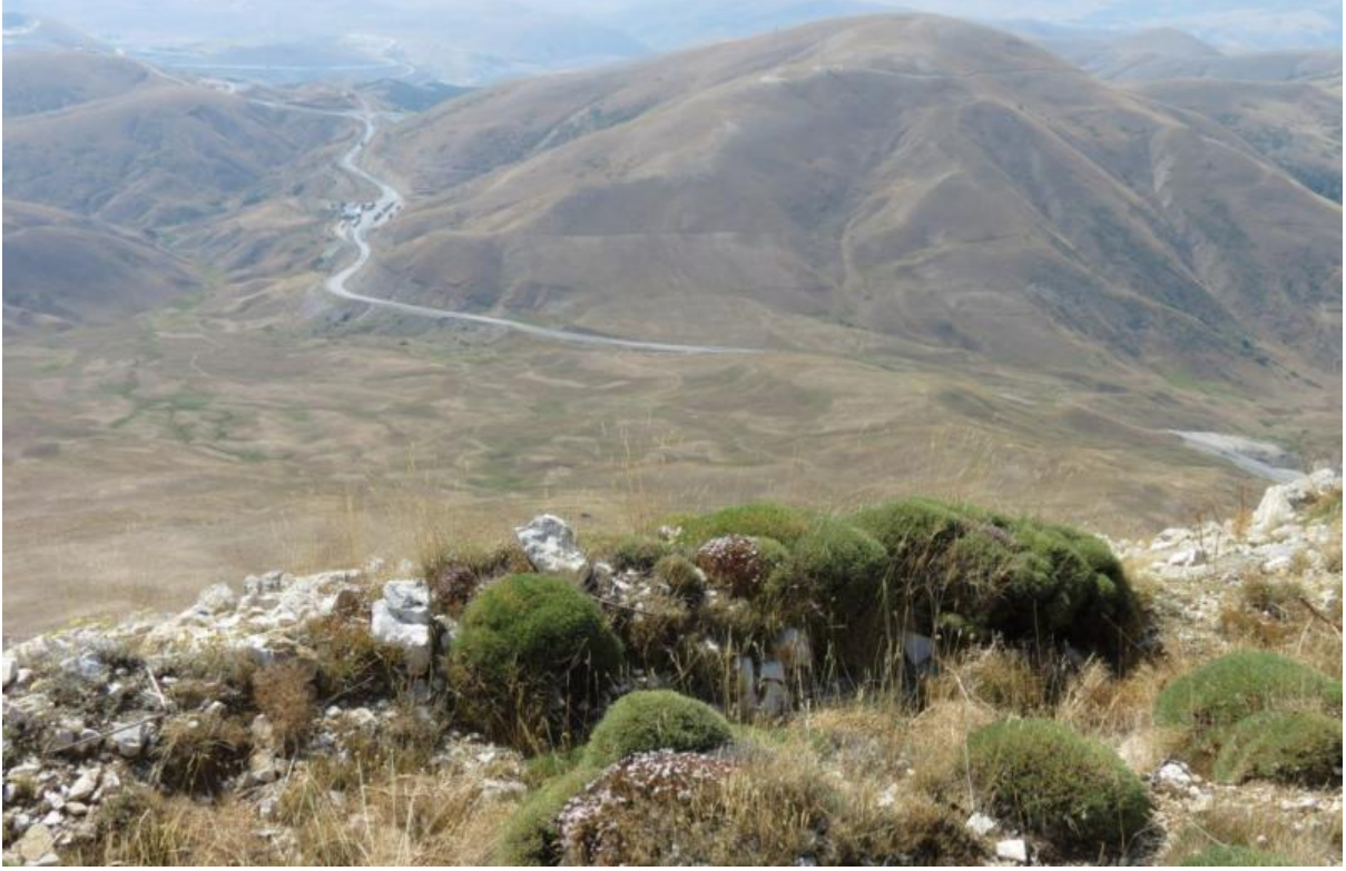
Şekil 7: Kop Dağı mevziileri