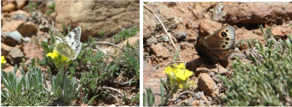
Şekil 4: Kop Dağı'nda görülen bazı kelebek türleri

Kop Dağı, Türkiye'nin en zengin kelebek alanlarından biridir. Alan, varlığını sürdüren kelebek türlerinin 10 tanesi endemik, 37'si nadir olmak üzere toplam 134 kelebek türüne habitat oluşturan bir ekosisteme sahiptir (OSİB 2017; 24) (Şekil 4).