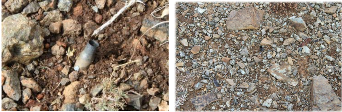
Şekil 3: Kop Dağı mevzilerinde bulunan savaş malzemeleri