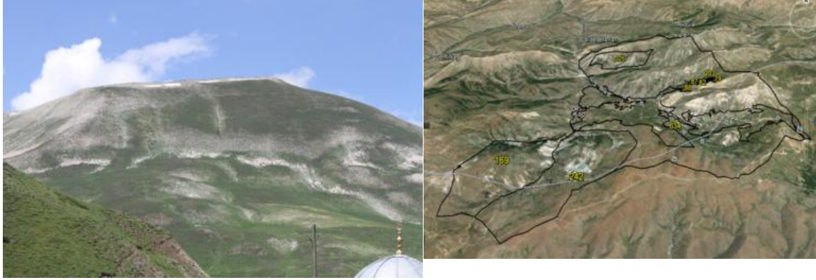
Şekil 2: Kop Dağı

Kop Dağı Müdafaası Tarihi Milli Parkı yasal anlamda Türkiye'nin 42. milli parkı olarak 2016 yılında ilan edilmiştir. Söz konusu milli parkın sahip olduğu doğal değerlerinin yanı sıra I. Dünya Savaşı'nda Rus ordusunun durdurulmasında büyük önem taşıyan, gerek savaşın gerekse Türklerin geleceğini belirleyen önemli bir cephe olması, tarihi ve anıtsal değere sahip olması nedeni ile milli park statüsüne kavuşturulmuştur (şekil 2,3).