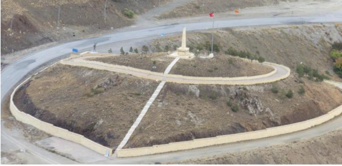
Şekil 6: Kop Şehitlik Anıtı

Kop Geçidi'nin bulunduğu noktada 31 Ağustos 1963 yılında açılışı yapılan ve köylü-şehirli bütün Bayburt halkı ile beraber Bayburt garnizon komutanı tarafından yaptırılan "Kop Şehitleri Abidesi" yer almaktadır (Şekil 6).