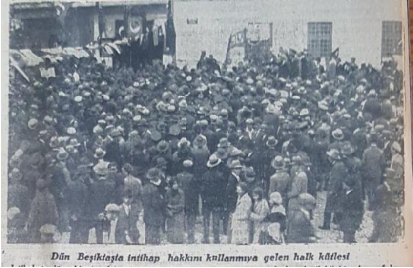
Vakit 12 Teşrinievvel 1930