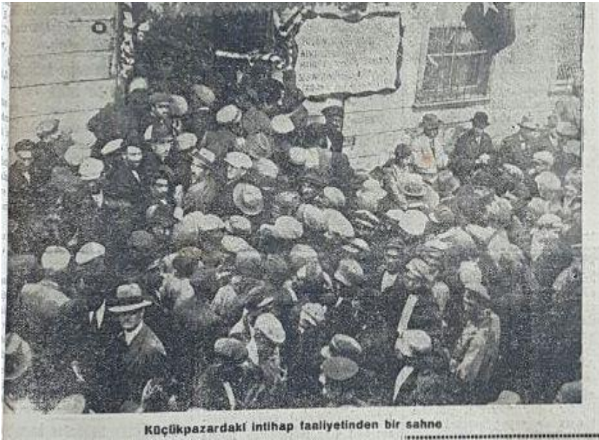
Akşam 8 Teşrinievvel 1930